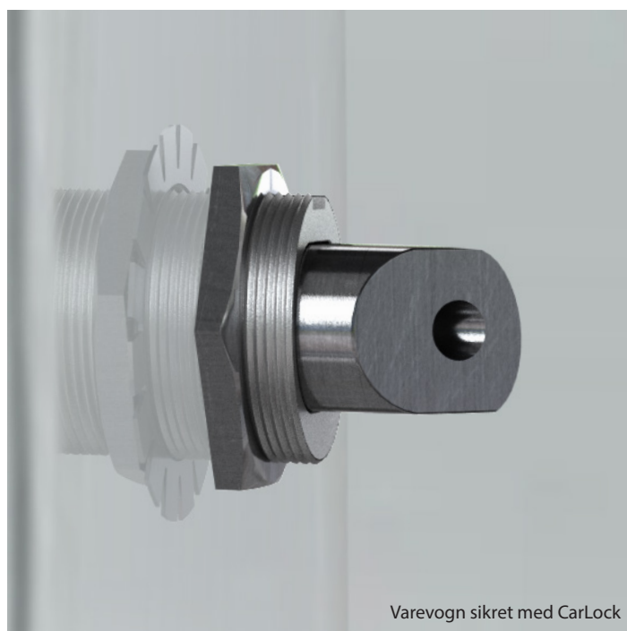
Varevogn sikret med CarLock