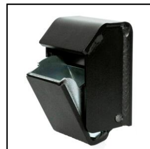
B-Lock Combi Elektronisk DIM: B135xH225xD100