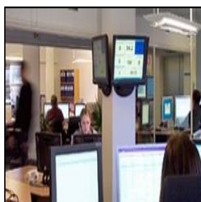
Åbning via kontrolcentral