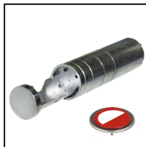
B-Lock Flex Elektronisk Ø50xD190