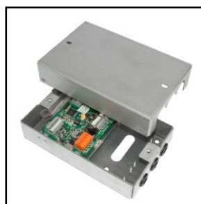
Ankerboks m/ elektronik. DIM: B107xH167xD35