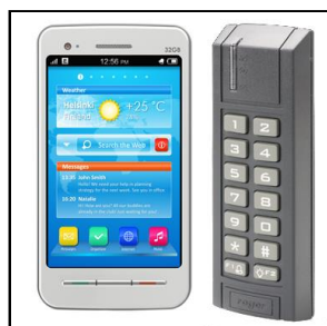
Åbning via SMS eller kodemastatur/prox