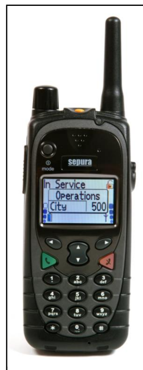
Åbning via SINE terminaler på TETRA platformen