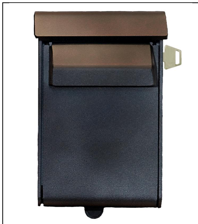
Mekanisk nøgleboks med indlevering DIM: B135xH225xD100