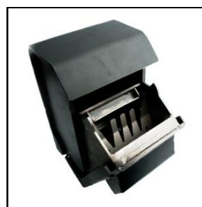
Nøgleindkast med fiskesikring