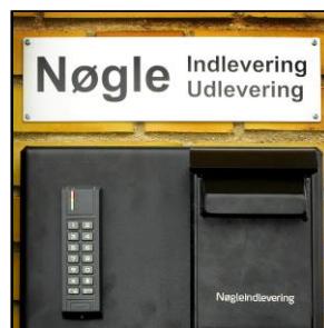
Standard skilt DIM: B:355xH120xD1