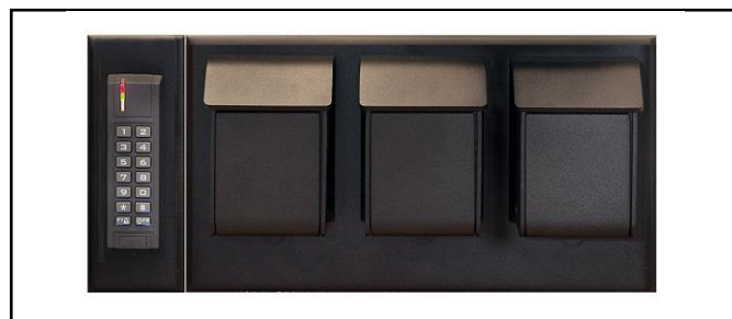
Eks. på elektronisk udlevering af nøgler styret af kodetastatur DIM Tastatur; B95xH215xD40 DIM 3 Bokse: B355xH215xD40