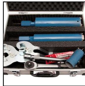
Borekuffert: Diamantbor og fikseringsværktøj mm.