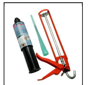
2 komponent monteringslim og fugepistol

Birepo er Skandinaviens største & eneste producent og leverandør af såvel mekaniske, elektro-mekaniske og fuld intelligente sikringsløsninger. Med over 20 patenter og godkendelser i portefølje serien B-Lock, er platformen skabt til alle niveauer af løsninger indenfor sikring og adgang til 3. part