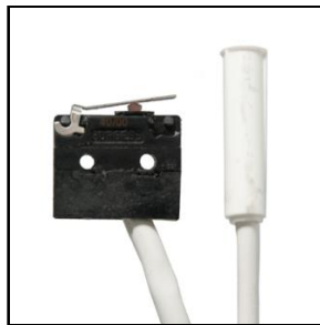
Micro- og magnet switch 0,5 til 2 meter ledning