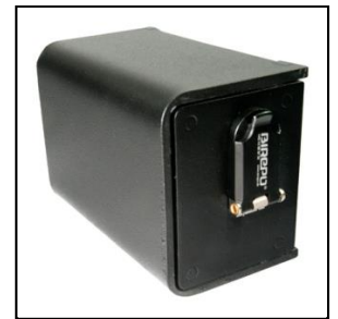
B-Lock Multi Boks med logo på dækrave