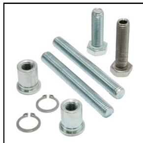
Bøsninger, M12 bolte og gevindstænger og –rør