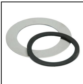
Rustfri dækring til Ø70 rør med tætningsliste (B20)