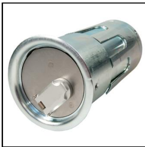
B-Lock Multi Ø70 rør med ekspansion uden logo