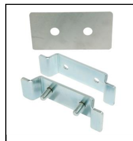
Bagplade (B170 x H90 x D1) Container beslag m/u bolte