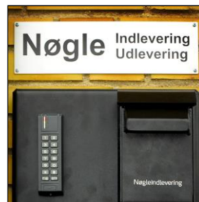
Standard skilt DIM: B:355xH120xD1