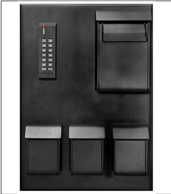
Model 1: 1 indlevering og 3 udleveringer styret af kodetastatur DIM: B355xH505xD40