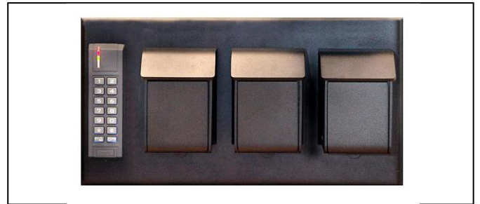
Model 2: 3 udleveringer styret af kodetastatur DIM: B415xH180xD40