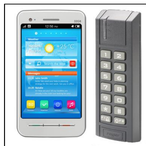
Forskellige åbnings muligheder