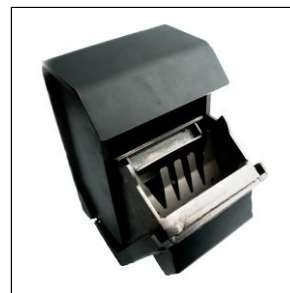
Nøgleindkast med fiskesikring