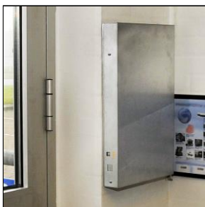
Ankerboks med elektronik DIM: B350xH545xD70